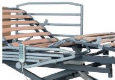
ASIDERO-BARANDILLAS CORTAS DE 4 TUBOS