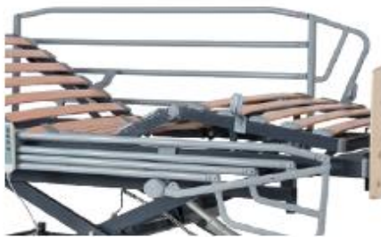
BARANDILLAS PLEGABLES DE 4 TUBOS