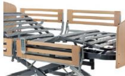
BARANDILLAS SEGMENTADAS DE MADERA