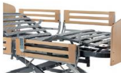
BARANDILLAS SEGMENTADAS DE MADERA