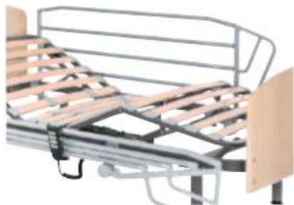
BARANDILLAS PLEGABLES DE 4 TUBOS