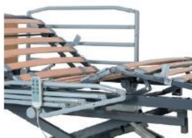
ASIDERO-BARANDILLAS CORTAS DE CUATRO TUBOS